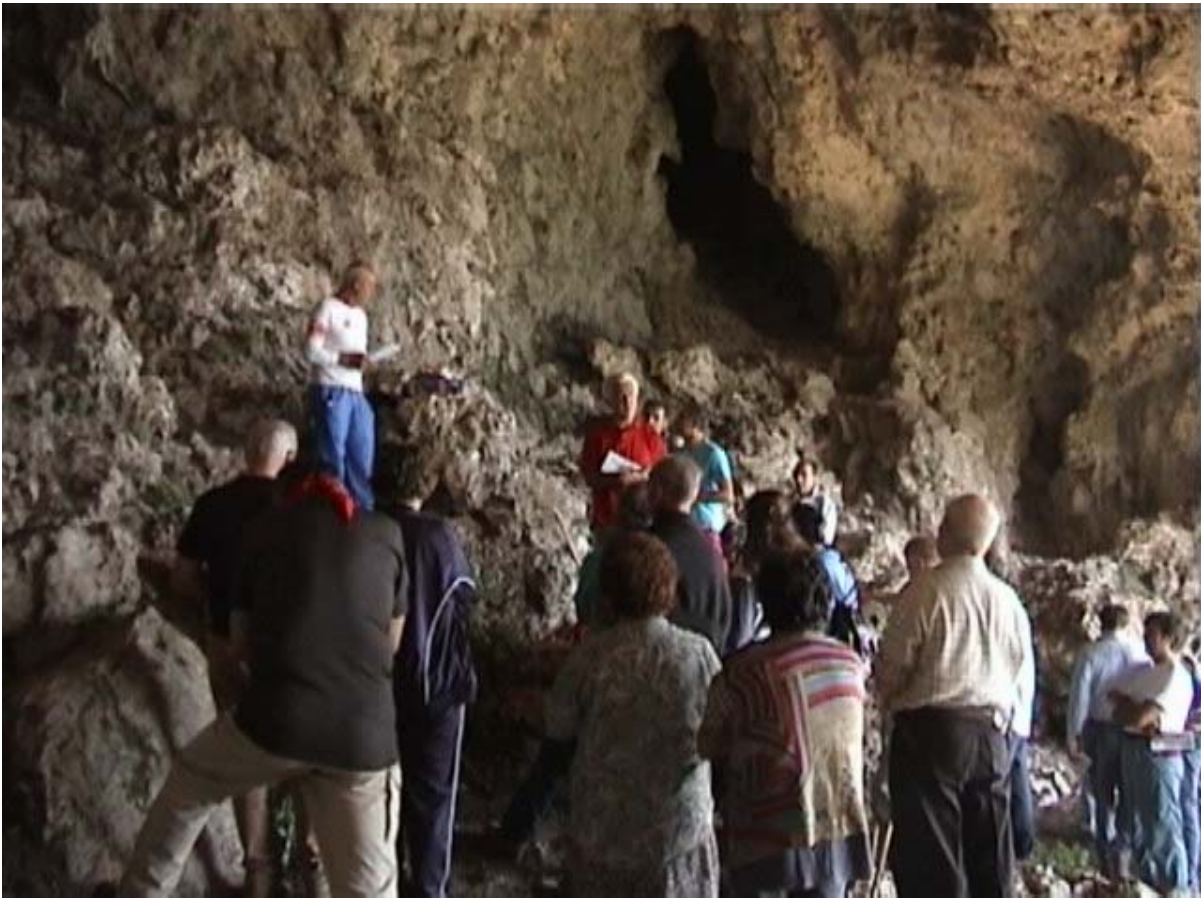
"Pellegrini di montagna - Ottobre 2001 -"