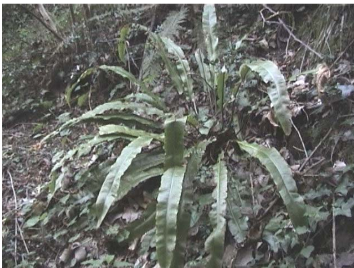
"La scolopendra della Vena di Capomazzo"