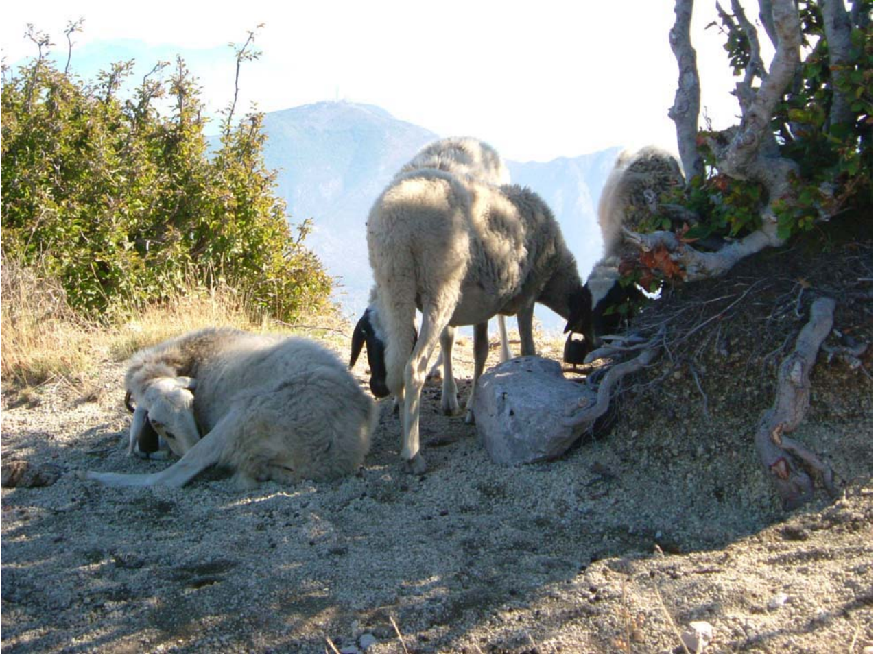
"Le creature della Grotta"