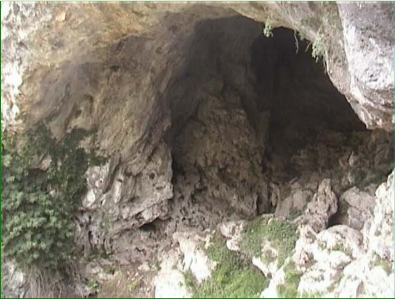
“ L'entrata della Grotta di S. Maria della Speranza”

La strada del ritorno è la stessa dell'andata,