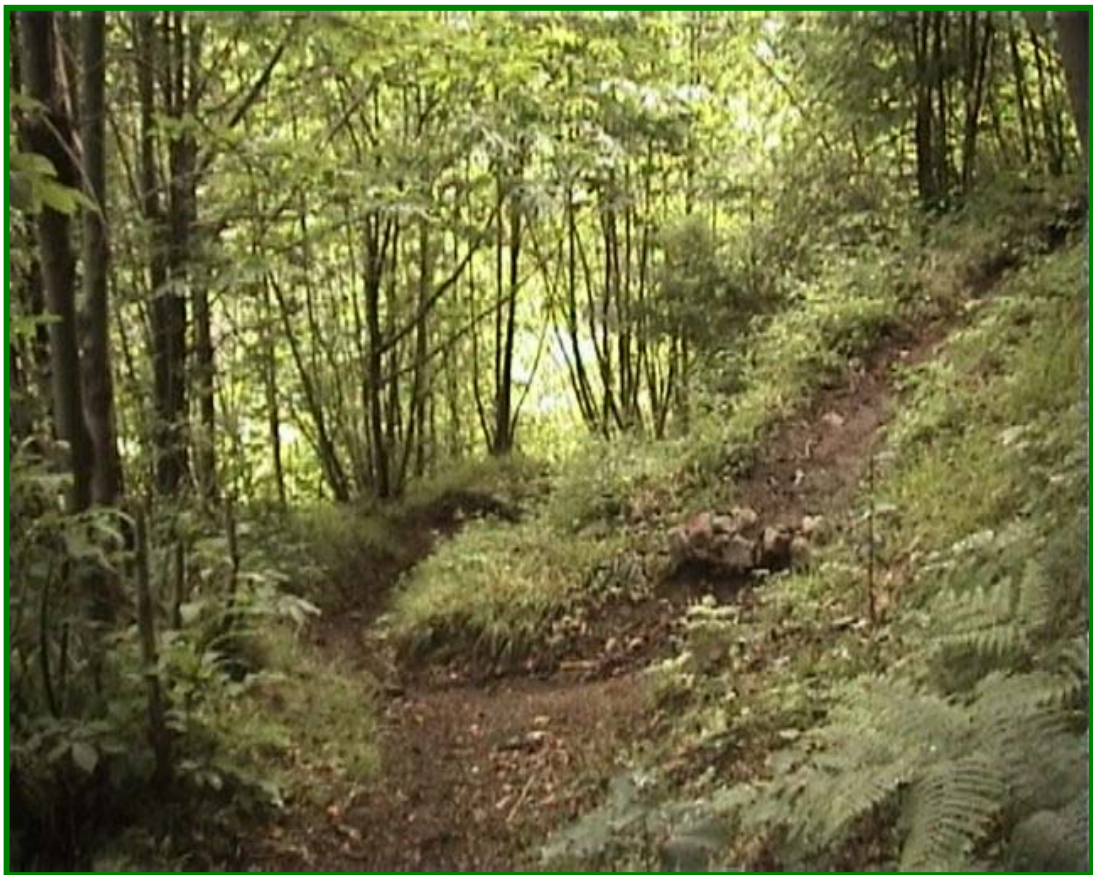
"Bivio sentieri n.1 - n. 4"