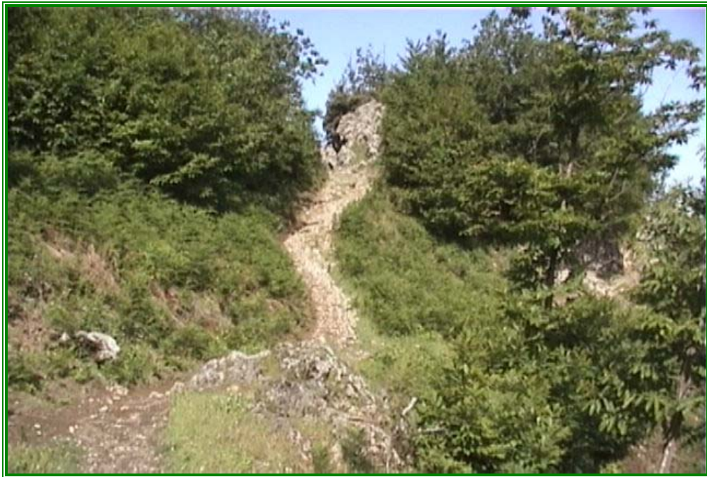
"Il sentiero n. 4 verso Orsano"

Una passeggiata di tre-quattro ore da fare con gli amici, panoramica e interessante, ideale per gli appassionati di botanica.