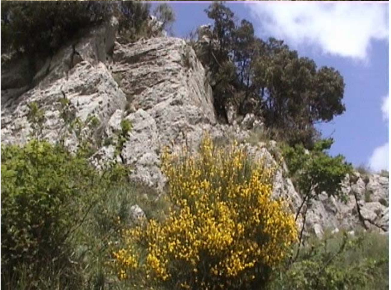
"Intorno alla Grotta: Natura incontaminata"