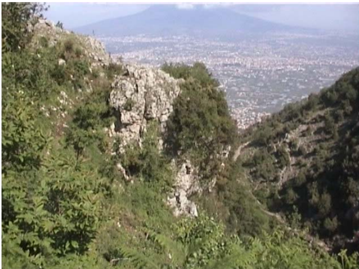
"Il Canyon della Vena Perciata -sentiero n.4"