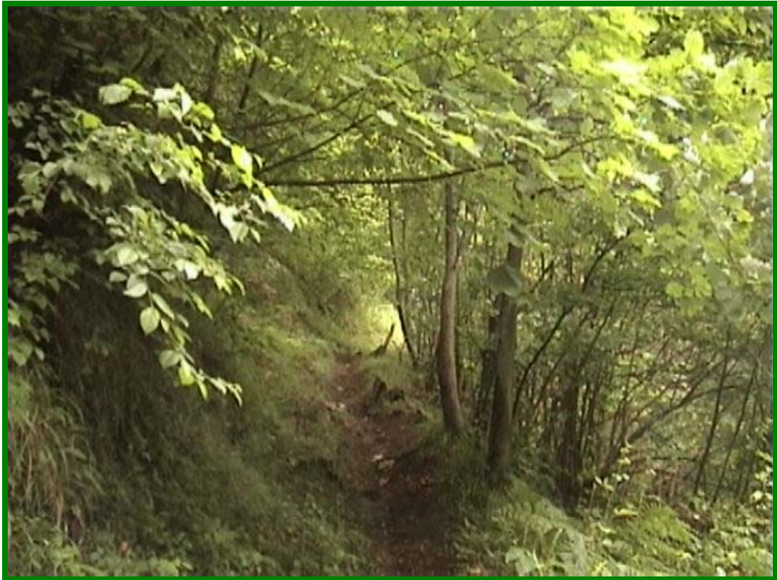
Ai lati del sentiero filari di castagni filtrano i raggi del sole in una mattinata di giugno