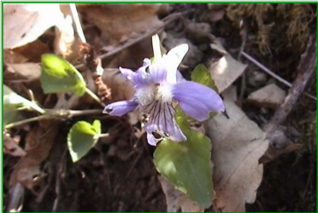
"L'Orchidea del Cerreto"