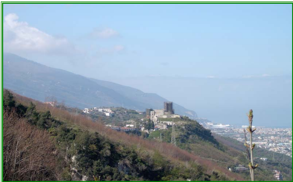
"Il Castello di Lettere dal sentiero n. 2"