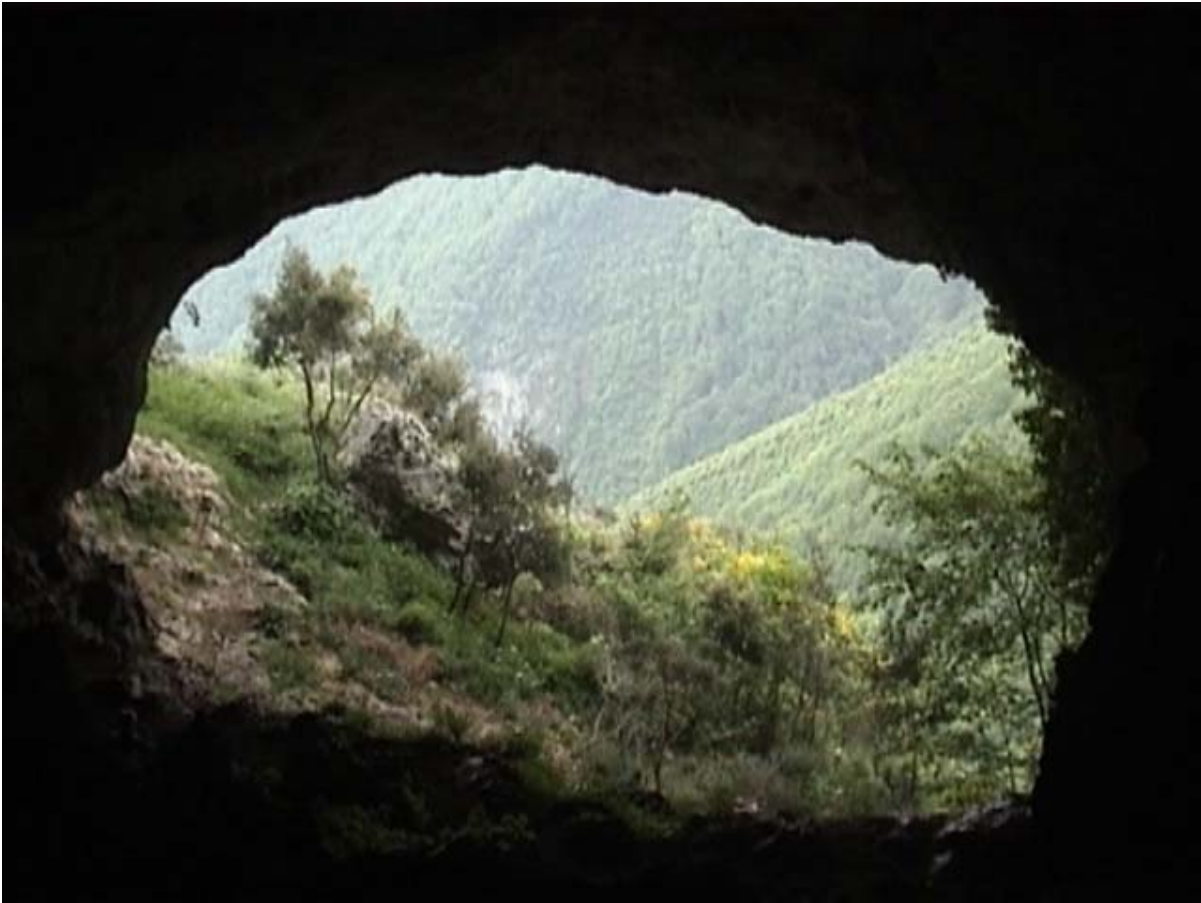
"Dall'interno della Grotta"