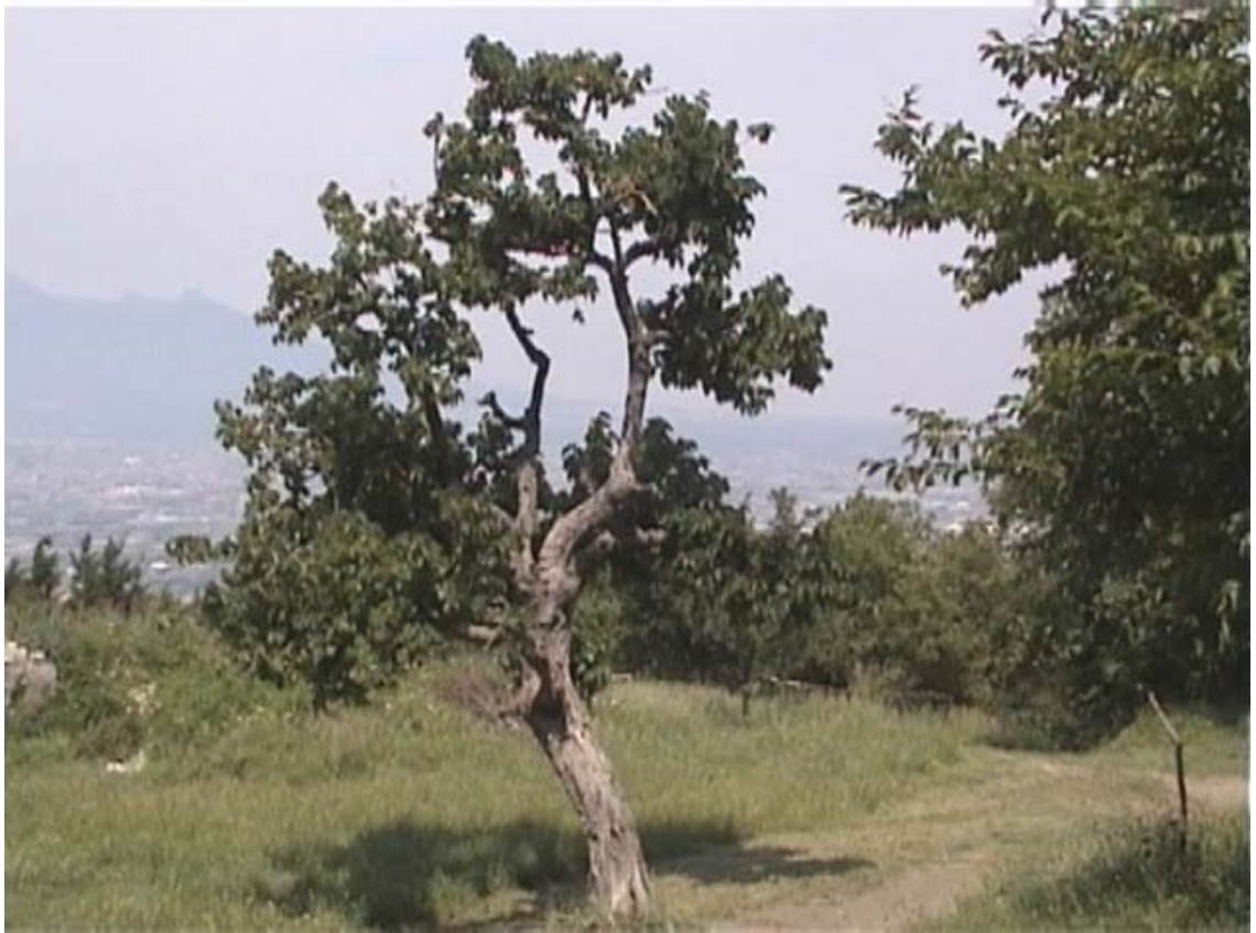
"L'albero di Gelso al centro del Chianiello"