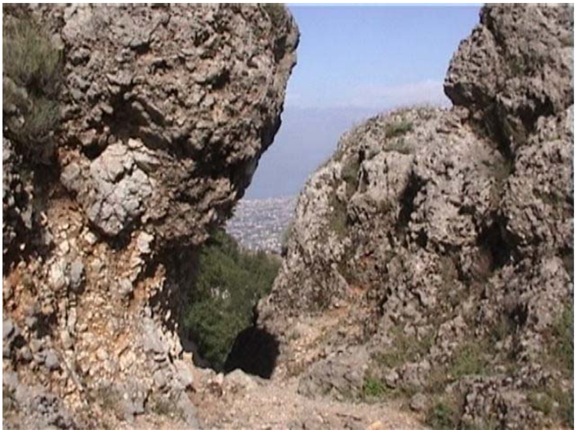
"Varco tra le rocce sul sentiero n. 2"