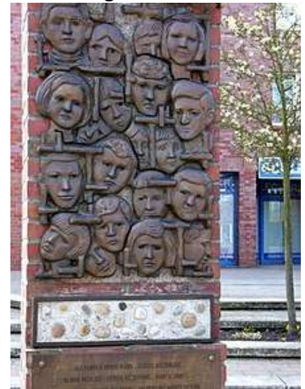
La stele in ricordo dei 20 bambini ad Amburgo