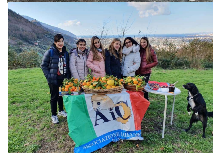
Alunni di S. Antonio Abate